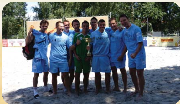
Hecht Plzeň - vítěz 2011